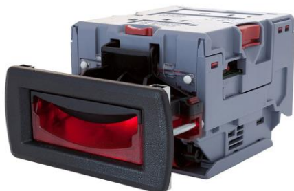
ช่องหยอดเหรียญ รุ่น NV10 (รองรับธนบัตร 20,50,100,500,1000 บาท)