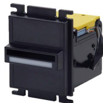
ช่องหยอดเหรียญ รุ่น NK77 (รองรับธนบัตร 20,50,100,500,1000 บาท)