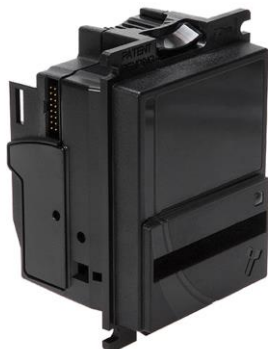
ช่องหยอดเหรียญ รุ่น BV-20 (รองรับธนบัตร 20,50,100,500,1000 บาท)